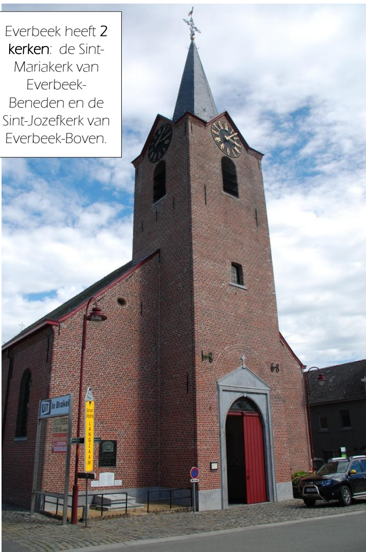
Everbeek heeft 2 kerken: de Sint-Mariakerk van Everbeek-Beneden en de Sint-Jozefkerk van Everbeek-Boven.

In het verlengde van het Brakelbos vind je in Everbeek de vallei van Trimpont . Het gebied wordt omschreven als "een woud zonder einde en zonder genade". Je vindt er een oud kruis dat met de jaren vergroeid is in een eikenknot.